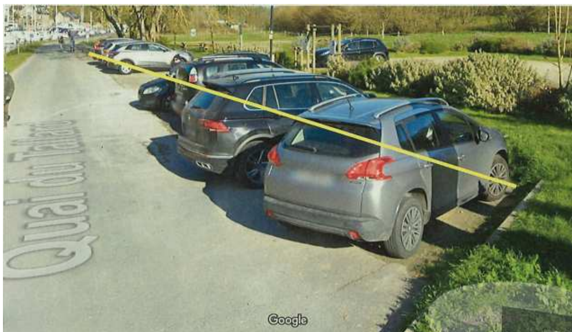
Ensemble des parkings de la Maison de la Rance interdits au stationnement :