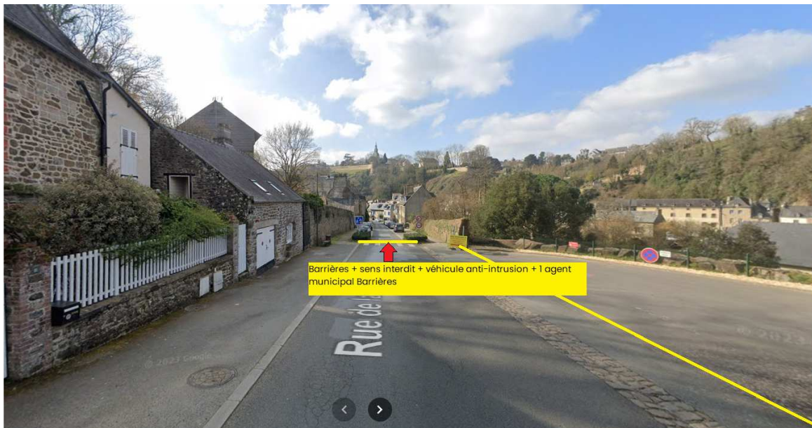
Place de retournement rue de la Madeleine (Hôtel Mercure) : de 18H00 à 00H30 :