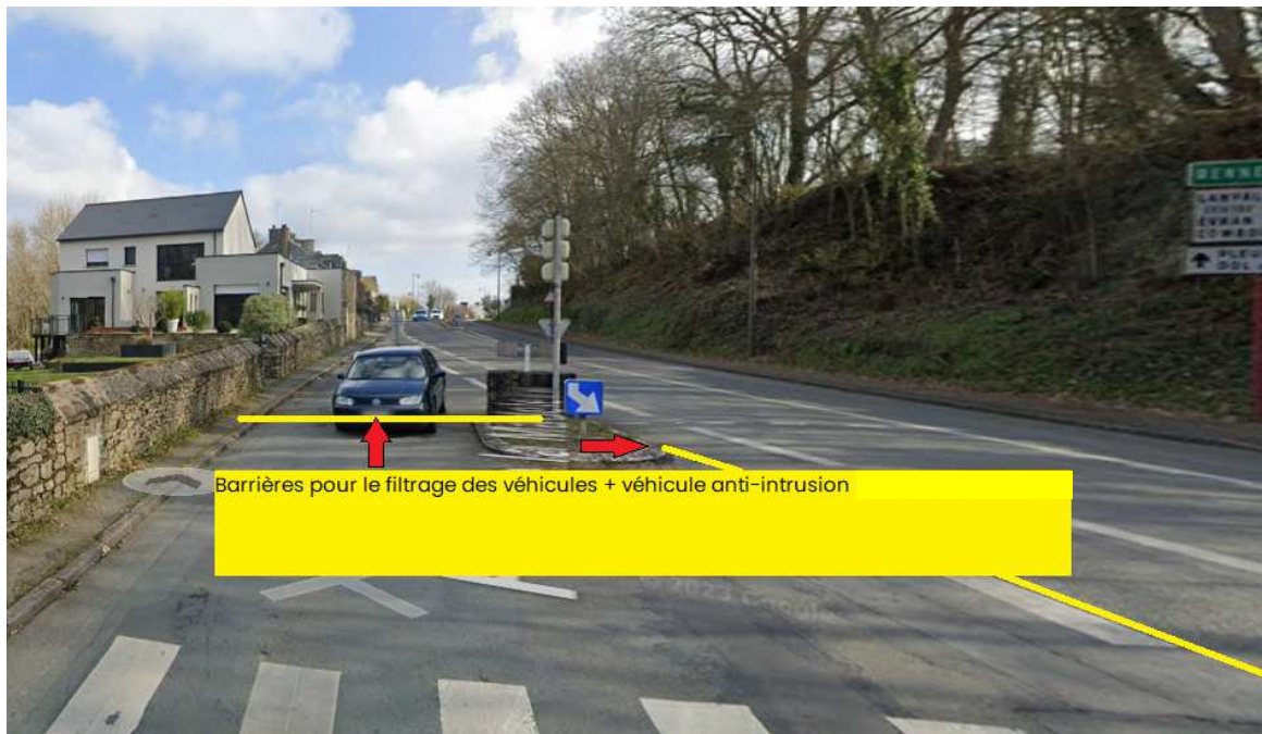
Haut de la rue de la Madeleine :