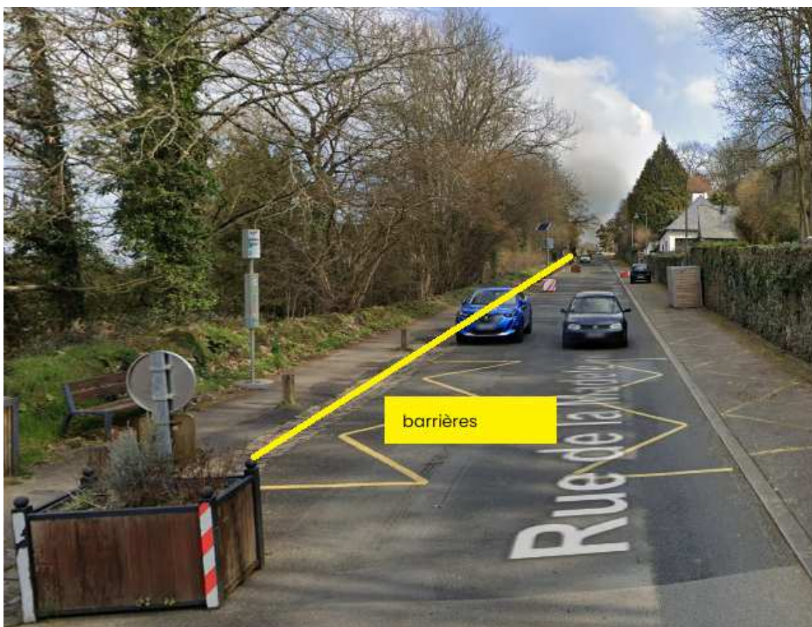
Avant le 10 rue de la Madeleine :

Pour délimiter le périmètre de sécurité :