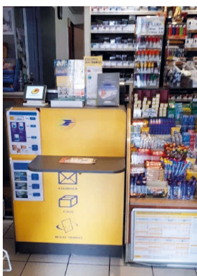
Bar Tabac Saint-Brieuc Gouédic