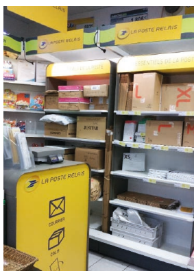
Presse Rennes La Poterie